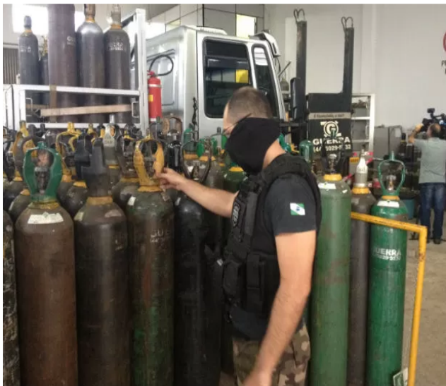
Segundo as investigações, cilindros industriais eram vendidos como se fossem medicinais

Ainda de acordo com o Gaeco, há cerca de outras dez empresas que estão sendo investigadas.